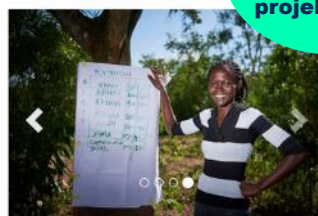
Spenden Sie einen effizienten Kocher für Frauen in Kenia! i