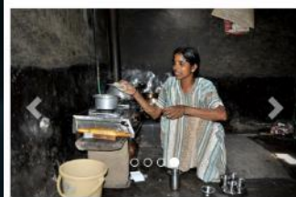
Unterstützen Sie eine Familie in Indien mit einer Biogasanlage! i

Zertifizierte & geprüfte Klimaschutzprojekte